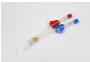
Raccords «Y» uniponcture