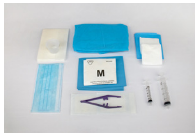
Set hémodialyse par fistule