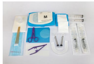
Set hémodialyse sur cathéter