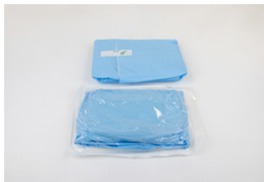
Blisters souples et champs stériles